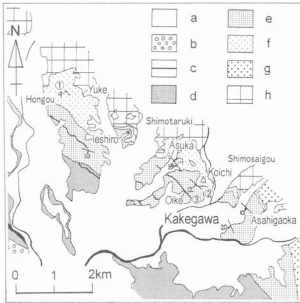
Fig.2 Geological map of the northwestern part of Kakegawa City compiled after Yokoyama et al. (2000). a: Holocene, b: Ogasa Group, c-g: Kakegawa Group (c: Volcanic ash, d: Hijikata Formation, e: Tenno Silty Sand Member of the Dainichi Formation, f: Dainichi Sand Member of the Dainichi Formation, g: Kamiuchida Formation), h: Miocene or Paleogene basement rocks. The locality of the sampling sites is shown by circled numbers (①Hongou, ②Koichi, ③Kamiyashiki)